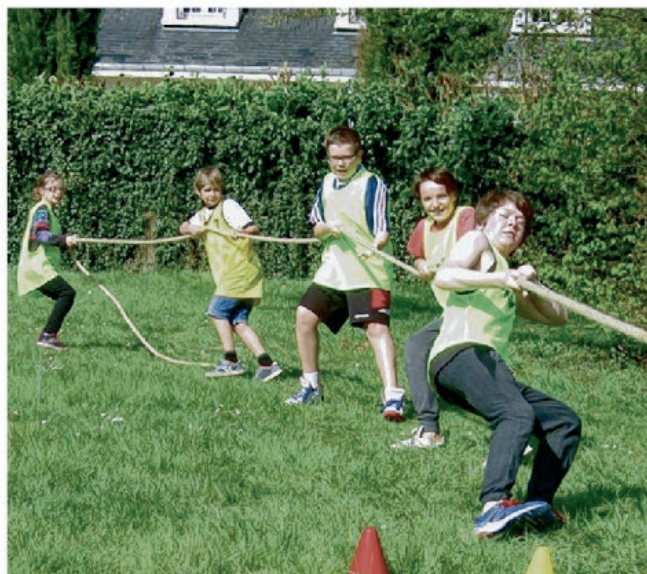
Le tir à la corde, l'une des disciplines proposées lors des Olympiades.

Ce dimanche, il y avait comme les prémices des Jeux olympiques à Méré. Il faisait beau comme à Rio de Janeiro dimanche après-midi pour la seconde édition